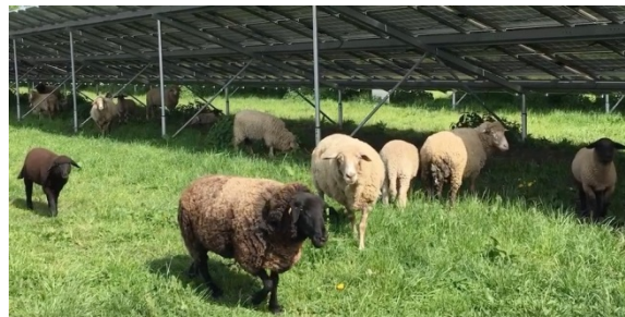
Τυπικά παραδείγματα φωτοβολταϊκών πάρκων