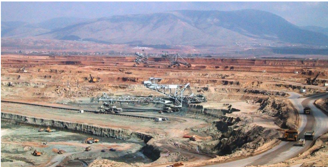
Λιγνιτωρυχείο στη Δ. Μακεδονία